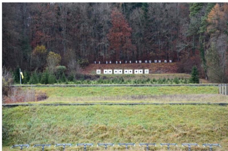
Schiesstand Langriet Neuhausen